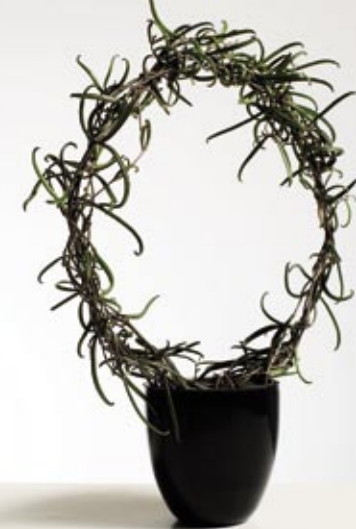
Bryophyllum scandens 'Kalahari® Survivor'

Planten er en særdeles nøjsom plante fra Madagaskar og det sydlige Afrika. Kalahari® er en slyngende plante med smalle kraftige blade, der er skinnende mørkegrønne. I stærkt sollys bliver bladene rødlige. Planten bliver opbundet på bøjle, og på bøjlen er vedhæftet en lille folder med nærmere oplysninger om denne spændende plante. Kalahari® kan placeres overalt i hjemmet, gerne så lyst som muligt. Tåler fuld sol og lettere udtørring mellem vandingerne. Planten har salgssæson hele året.