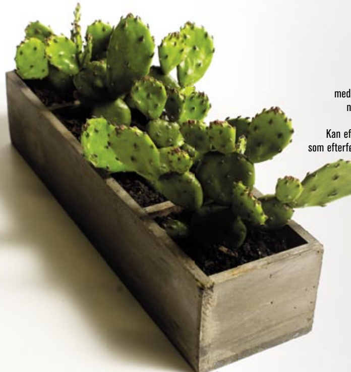
Opuntia humifusa Figenkaktus

Trægagtig plante med et bonsaiagtigt udseende. Som populærnavnet antyder, har planten en svag duft af peber. Bladene er grønne og glansfulde og har næsten samme form og størrelse som bladene hos Mimosa. Placeres lyst, men ikke i direkte sol. En ikke særlig krævede plante, der bør holdes jævnt fugtig og gødes jævnlige i vækstsæsonen. Planten har salgssæson hele året.