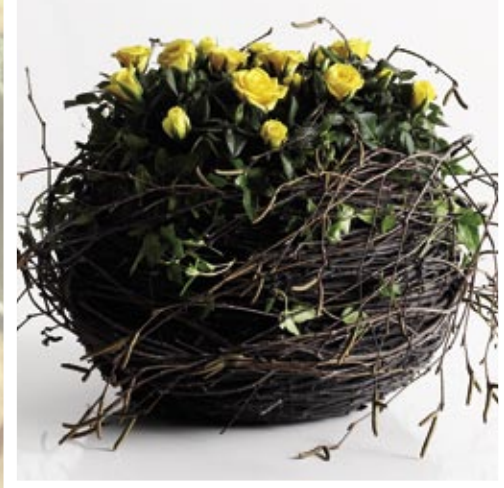
Kuglekurv af birk fyldt med gule mini Rosa. Hedera og birkegrene giver bevægelse og sammenhæng i dekorationen