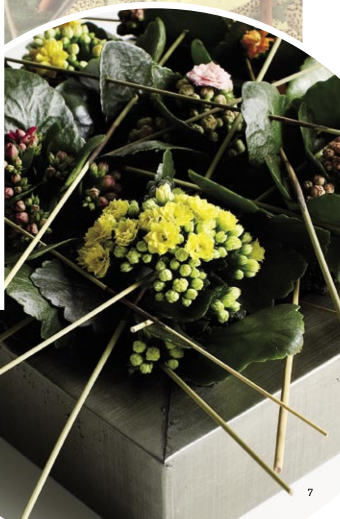
Farvede pinde skaber forbindelse mellem Kalanchoe-planter i forskellige farver