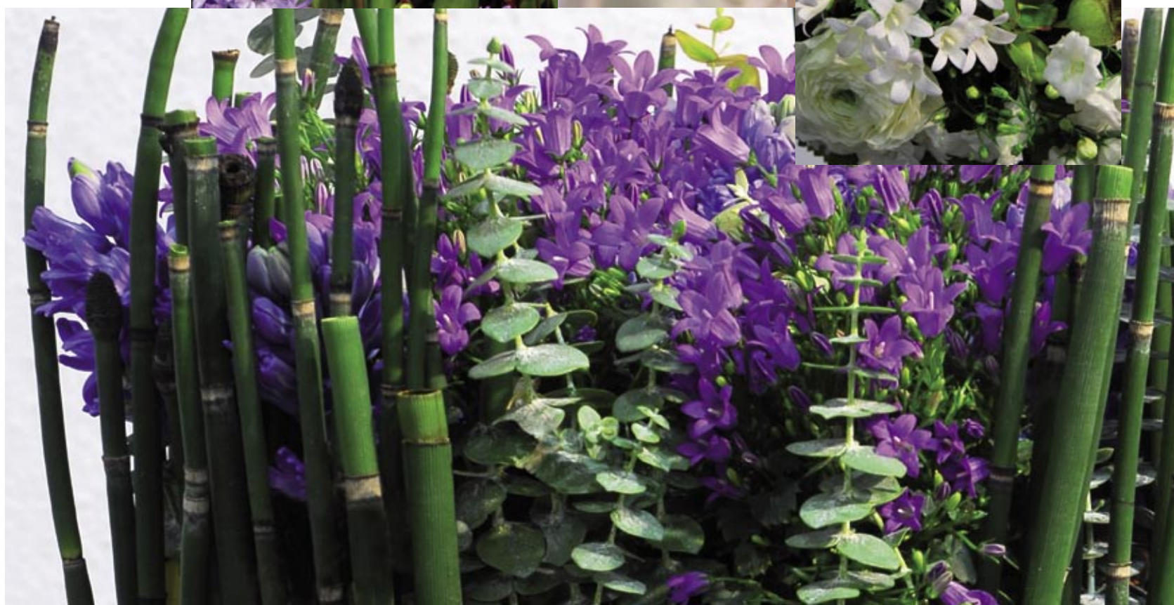
Mini Campanula og Hyacinthus brugt i dekoration i oasis på et fad