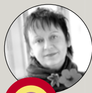
Ide, styling og tekst: Anette Ekmann Ekmann Alvine

Farver fremmer forståelsen, farver frister - frisker op og ikke mindst, sætter fantasien i gang. Endelig ses farverne igen i boligindretningen, og selvfølgelig skal blomsterbutikkerne ikke stå tilbage for hverken møbel- eller varehuse. Det gælder om at turde noget, det at gøre noget helt andet. Ikke overdrive, det skal stadigvæk være minimalistisk og storbyagtigt. Tænk på et kunstmuseum eller en designudstilling - hvor man tit og ofte bruger enkle, men effektive elementer for at fremhæve budskabet. Kniber det med inspirationen, vil jeg gerne slå et slag for, at man tager sig tid til at rejse ud i verden. Priserne på flybilletter er efterhånden helt i bund, og man behøver ikke at bo på det dyreste hotel, når man alligevel er på gaden udstyret med et digitalkamera hele dagen lang. Her viser jeg de idéer, jeg har spottet på efterårets inspirationsture, som alle passer perfekt til den nye plantetrend Colour Drops.