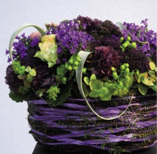
Mini Campanula brugt i dekoration i oasis sammen med snitblomster

Miniplanter er en god salgsvare i butikken. Anvendelsesmulighederne er mange – solo, som kuvertdekoration på bordet, flere ens planter sammen og i dekorationer.