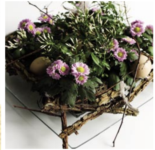
Chrysanthemum, Jasminum og æg samles af grene fra korkelm, som understreger underlagets form