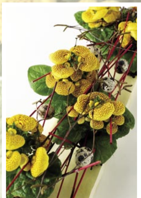
Calceolaria "svævende" på birkegrene og røde pinde med vagtelæg